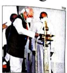
Governor Arif Mohammad Khan inaugurates the centenary celebrations of UC College, Aluva, by lighting the lamp on Monday

"The college, just like a small seed planted 100 years ago having grown into a huge tree, continues to nurture the talent and transform youngsters into responsible citizens. The college has played a crucial role in the social, cultural and politi-