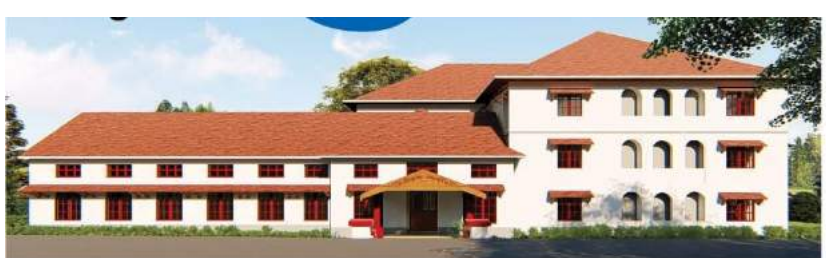
മരുലവ യാസി, കോജ്യേൽ നിർമിക്കുന്ന പത്തിയ ലൈബറിയുടെ രേഖാപിത